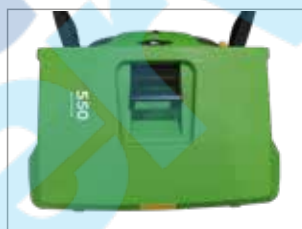
ВЕЛИКИЙ БАК 25 Л, ЛЕГКО СПОРОЖНЮЄТЬСЯ