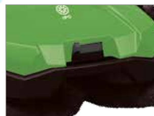
ЩІТКА З РЕГУЛЮВАННЯМ ВИСОТИ