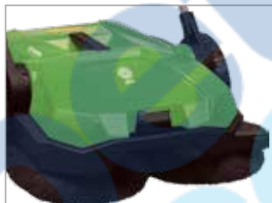
ЗАПАТЕНТОВАНА СИСТЕМА СМІТТЯ